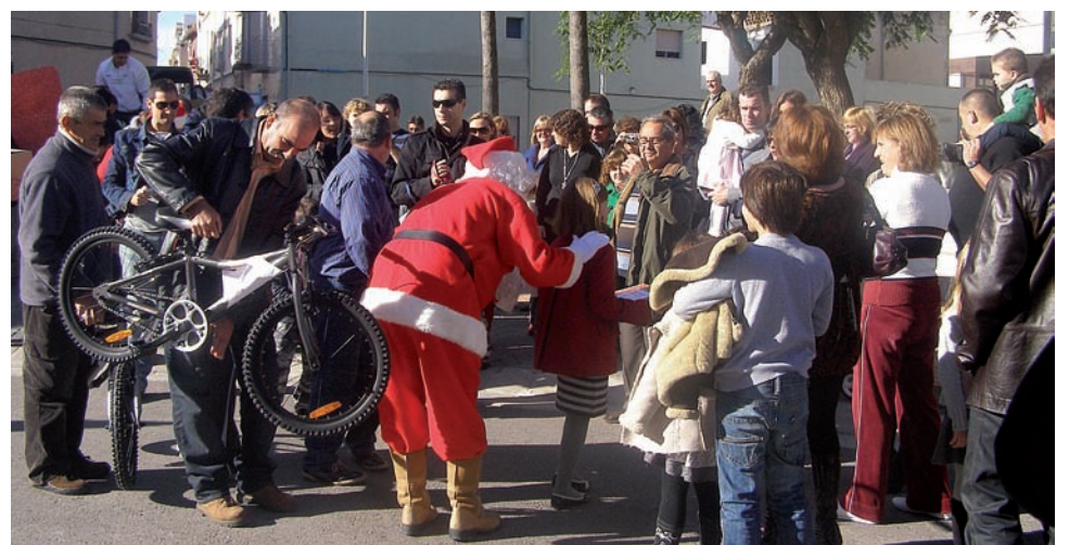
CAVALCADA PARE NOËL