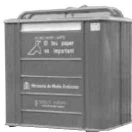
PAPEL Y CARTÓN: COLOR AZUL