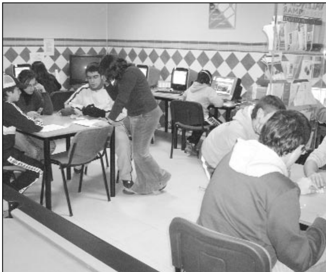
Los jóvenes acuden a las instalaciones del Centro de Actividades Juveniles

Además de disponer de estas instalaciones, desde el Centro de Actividades Juveniles se está coordinando desde su apertura una amplia programación de actividades, como campeonatos de juegos de mesa y talleres. Asimismo, para los días 9, 10 y 11 de febrero se