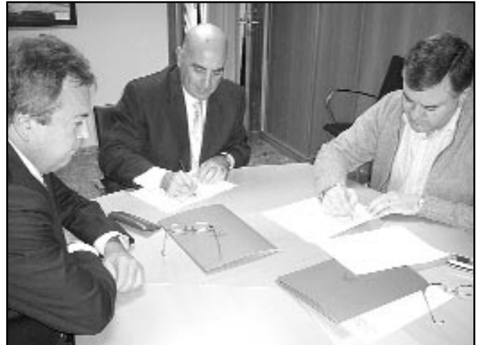
La firma del convenio tuvo lugar en el Ayuntamiento

a personas mayores de 45 años, mujeres, discapacitados, parados de larga duración, familias monoparentales y población inmigrante. Los microcréditos son préstamos que no requieren de las garantías y avales necesarios para acceder a los créditos del sistema financiero tradicional y se conceden bajo la tutela de diversas entidades sociales. Su importe medio oscila entre los 8.000 y los 15.000 euros y su plazo de reembolso es de 4 años a un interés muy ventajoso. El carácter social de los microcréditos viene avalado por el hecho de que más del 73% de sus beneficiarios sean mujeres y más de un 26% de los microemprendedores sean inmigrantes, dos de los sectores de población con mayores dificultades de acceso al mercado laboral. Cada microcrédito