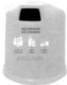
PLÀSTICS I BRICS: COLOR GROC