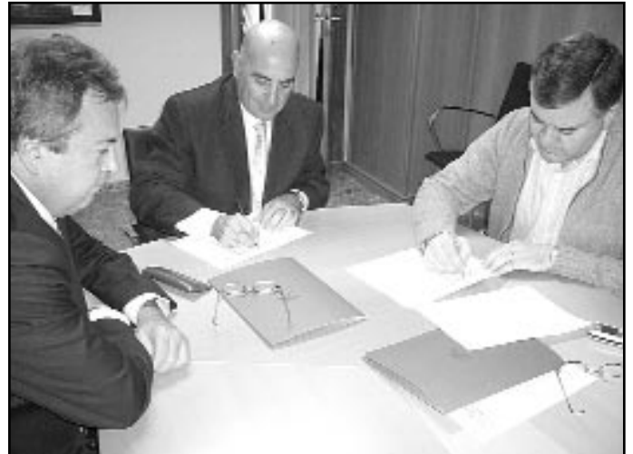
La firma del conveni tingué lloc a l'Ajuntament

ment a persones majors de 45 anys, dones, discapacitats, desocupats de llarga duració, famílies monoparentals i població immigrant. Els microcrèdits són préstecs que no requereixen de les garanties i avals necessaris per a accedir als crèdits del sistema financer tradicional i es concedixen davall la tutela de diverses entitats socials. El seu import mitjà oscil·la entre els 8.000 i els 15.000 euros i el seu termini de reembossament és de 4 anys a un interès molt avantatjós. El caràcter social dels microcrèdits ve avalat pel fet que més del 73% dels seus beneficiaris siguen dones i més d'un 26% dels microemprenedors siguen immigrants, dos dels sectors de població amb més dificultats d'accés al mercat laboral. Cada microcrèdit