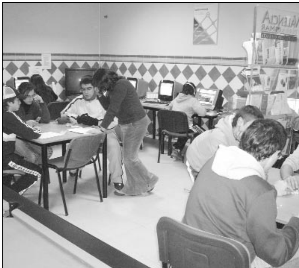
Els joves de Miramar utilitzen les instal·lacions del Centre d'Activitats Juvenils

A més de disposar d'estes instal·lacions, des del Centre d'Activitats Juvenils s'està coordinant des de la seua obertura una àmplia programació d'activitats, com a campionats de jocs de taula i tallers. Així mateix, per als dies 9, 10 i 11 de febrer s'ha organitzat, en col·laboració amb altres Centres Juvenils de la Safor,