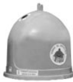
VIDRE I CRISTALL: COLOR VERD