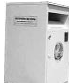
ROPA Y CALZADO: COLOR BEIGE

Utilicemos todos de forma correcta los contenedores