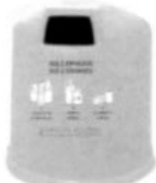
PLÁSTICOS Y BRIKS: COLOR AMARILLO