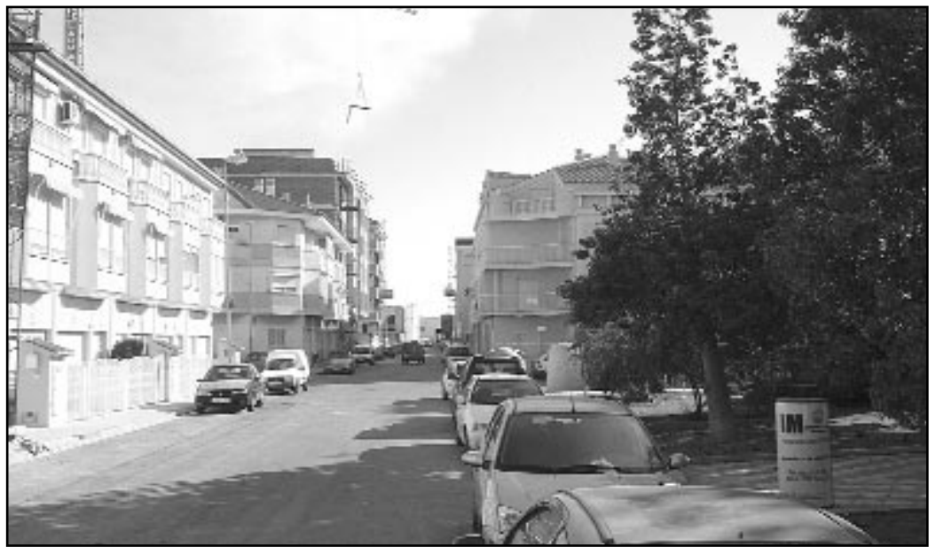
El carrer La vela és una de les zones que serà millorada per l'Ajuntament

Respecte a la zona oest del municipi, cal assenyalar que, en els últims mesos, "l'Ajuntament de Miramar ha realitzat un esforç per a millorar diverses infraestructures. A principis de l'any passat es va construir un nou col·lector de residuals, que recull les aigües generades en la zona oest del casc urbà de Miramar, entre els carrers Oliva i Gandia i el Polígon Industrial Les Vinyes. Esta nova infraestructura té l'objectiu d'evitar el possible col·lapse dels antics col·lectors, construïts fa dècades. La nova canalització enllaça amb els col·lectors ja existents en el carrer Ronda de Llevant, d'important diàmetre i amb capacitat suficient per a transportar les aigües residuals de eixa ampla zona del municipi. Paral·lelament a la construcció d'este col·lector de