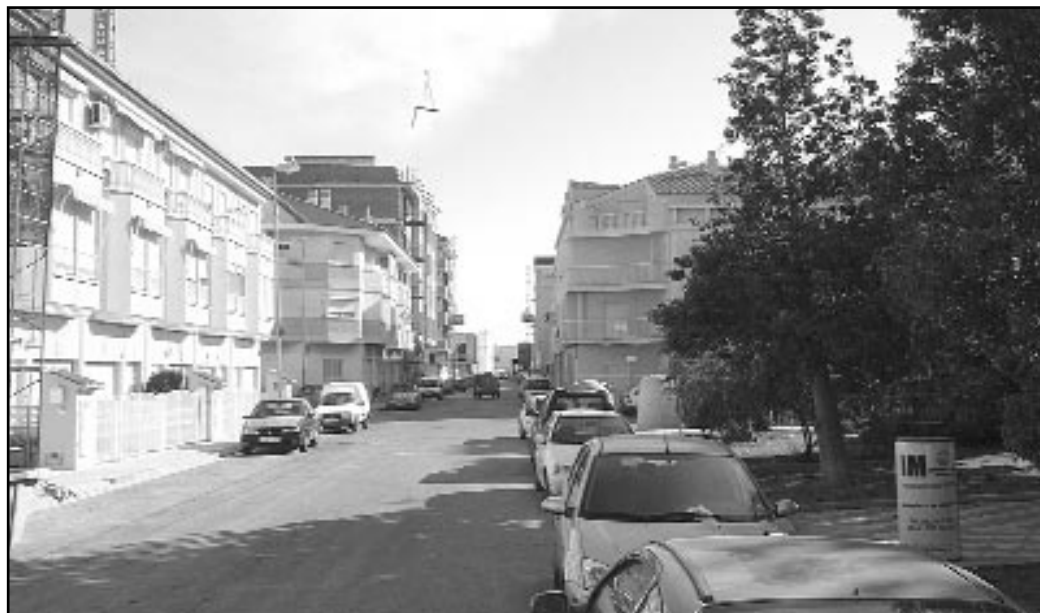
La calle La vela es una de las zonas que será mejorada por el Ayuntamiento

Con respecto a la zona oeste del municipio, hay que señalar que, en los últimos meses, "el Ayuntamiento de Miramar ha realizado un esfuerzo para mejorar diversas infraestructuras. A principios del año pasado se construyó un nuevo colector de residuales, que recoge las aguas generadas en la zona oeste del casco urbano de Miramar, entre las calles Oliva y Gandía y el Polígono Industrial Les Vinyes. Esta nueva infraestructura tiene el objetivo de evitar el posible colapso de los antiguos colectores, construidos hace décadas. La nueva canalización enlaza con los colectores ya existentes en la calle Ronda de Llevant, de importante diámetro y con capacidad suficiente para transportar las aguas residuales de esa amplia zona del municipio. Paralelamente a la