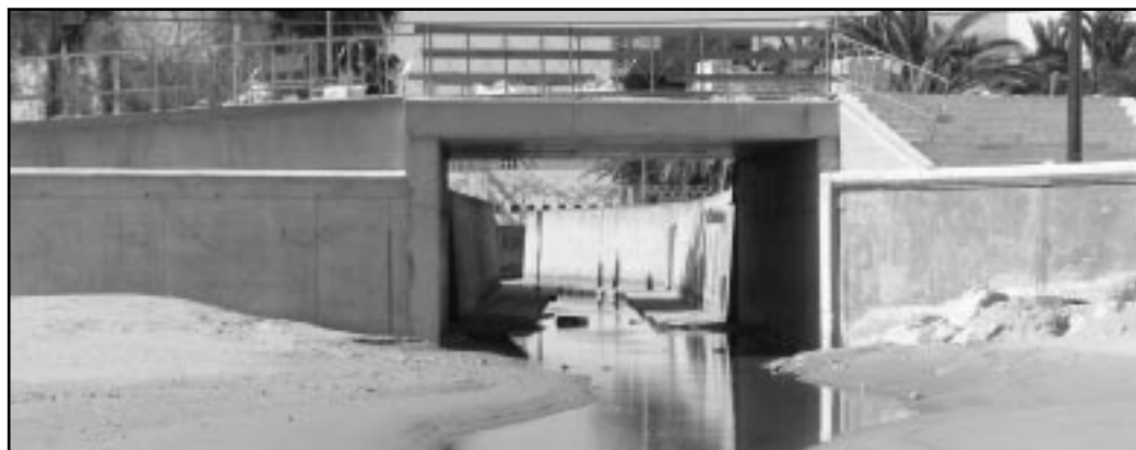
El nuevo Puente, ejecutado y financiado por el Ministerio de Medio Ambiente

A lo largo del presente año 2007, el Ayuntamiento de Miramar ha finalizado una de las actuaciones más importantes y necesarias para nuestra playa: la mejora integral de la Avenida de Francia. En concreto, se han acabado las canalizaciones de agua, luz y teléfono, se ha cambiado el alumbrado público y las aceras y se han