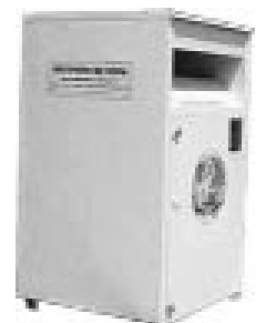
ROPA Y CALZADO: COLOR BEIGE

Utilicemos todos de forma correcta los contenedores