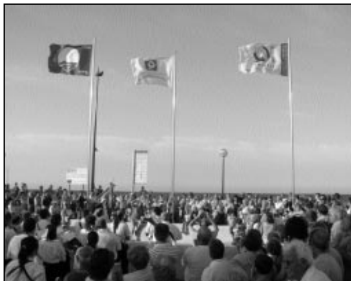
Las distinciones de calidad se izaron el día 12

En este sentido, la playa de Miramar también renovó el pasado mes de mayo el distintivo Qualitur, con-