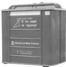
PAPEL Y CARTÓN: COLOR AZUL