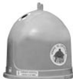
VIDRIO Y CRISTAL: COLOR VERDE