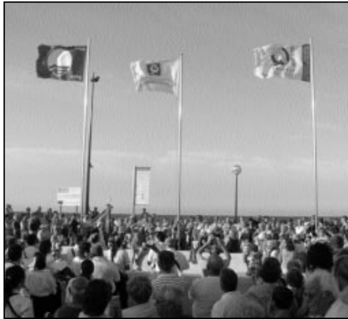
Les distincions de qualitat s'hissaren el dia 12

En este sentit, la platja de Miramar també va renovar el passat mes de maig el distintiu Qualitur, conce-