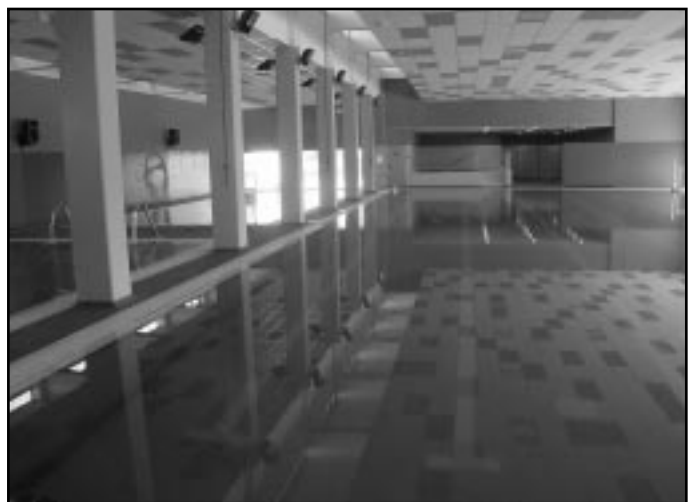
Así serán las dos piscinas del Complejo