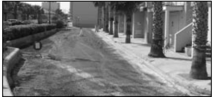
S'ha reasfaltat una ampla zona de carrer

esforç per a millorar diverses infraestructures. Durant el passat any 2006 es va construir un nou col·lector de residuals, que recull les aigües generades en la zona oest del casc urbà de Miramar, entre els carrers Oliva i Gandia i el Polígon Industrial Les Vinyes. Esta nova infraestructura ha sigut desenvolupada per a evitar el possible col·lapse dels antics col·lectors, construïts fa dècades. La nova canalització enllaça amb els col·lectors existents al carrer Ronda de Llevant, d'important diàmetre i amb capacitat suficient per a transportar les aigües residuals d'eixa ampla zona del municipi. Paral·lelament a la construcció d'este col·lector de residuals, l'Ajuntament també va portar a terme una nova canalització per a la recollida de les aigües pluvials de la zona. Esta canalització s'exten des del carrer Llebeig fins