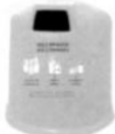
PLÁSTICOS Y BRIKS: COLOR AMARILLO