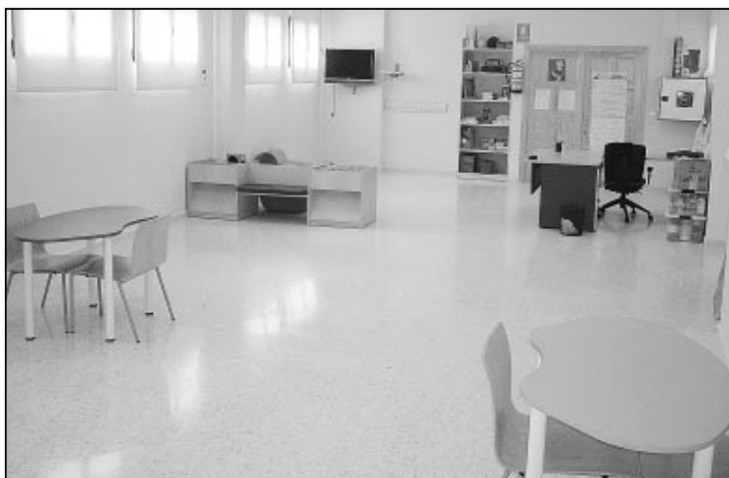
Los niños y niñas participan en actividades educativas, como talleres y juegos

Las instalaciones de la Ludoteca cuentan con mesas y sillas y con toda una serie de material lúdico y educativo. En la Ludoteca se desarrollan actividades como juegos, talleres y manualidades siempre con carácter educativo. De hecho, en la Ludoteca hay una gran cantidad de libros infantiles y una televisión con pantalla plana y reproductor de DVD, que permite la visualización de vídeos educativos. Hay que tener en cuenta que personal especializado se encarga de atender y enseñar a los niños y niñas. En este sentido, uno de los objetivos del Ayuntamiento de Miramar es que los niños y niñas que acuden en la Ludoteca "no vayan sólo a jugar. Queremos que aprendan y por eso organizamos actividades de tipo edu-