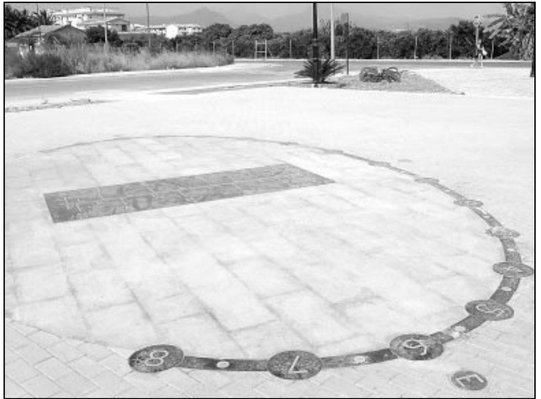
La imatge mostra el rellotge de sol analemàtic del nou Parc de Llevant

El Parc de Llevant compta amb una extensió de 2.200 metres quadrats. La seua principal característica és que està dotat d'un rellotge de sol de tipus analemàtic. En este sentit, cal assenyalar que un rellotge de sol analemàtic és aquell el gnòmon del qual (element que tira l'ombra per a marcar l'hora) ha de ser desplaçat en funció de l'època de l'any. D'esta manera, haurà de ser el propi visitant del parc qui, amb el seu moviment, marque l'hora en el rellotge per mitjà de la seua ombra. Per a tot això, el visitant compta amb unes marques en el sòl que li indiquen quina ha de ser la seua posició adequada, sempre diferent segons l'època de l'any. Dites marques es troben en la part