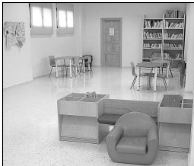
Personal especialitzat ensenya i atén als xiquets