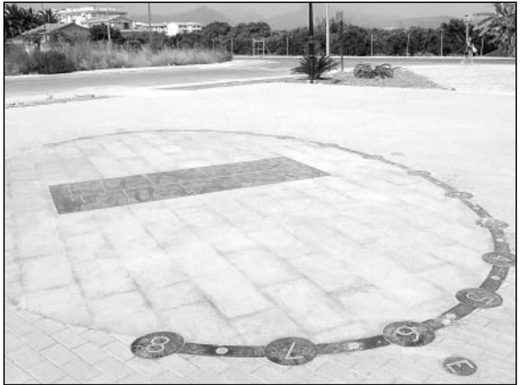
La imagen muestra el reloj de sol analemático del nuevo Parc de Llevant

El Parc de Llevant cuenta con una extensión de 2.200 metros cuadrados. Su principal característica es que está dotado de un reloj de sol de tipo analemático. En este sentido, hay que señalar que un reloj de sol analemático es aquel cuyo gnomon (elemento que tira la sombra para marcar la hora) debe ser desplazado en función de la época del año. De esta manera, deberá ser el propio visitante del parque quien, con su movimiento, marque la hora en el reloj por medio de su sombra. Para todo eso, el visitante cuenta con unas marcas en el suelo que le indican cuál debe ser su posición adecuada, siempre diferente según la época del año. Dichas marcas se encuentran en la