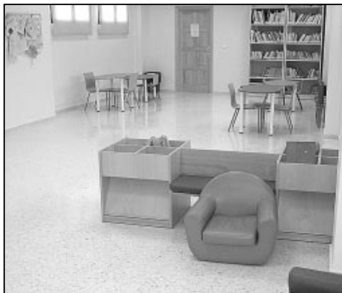
Personal especializado enseña y atiende a los niños