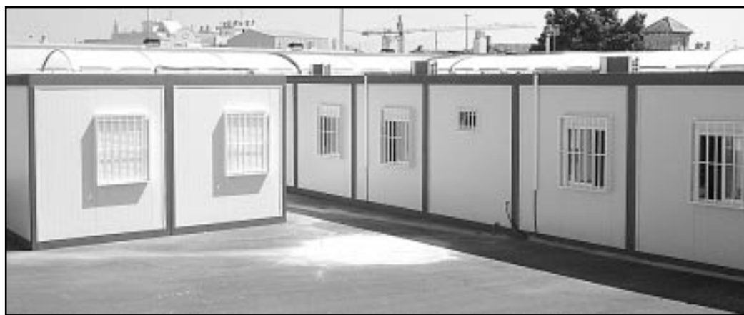
Les aules prefabricades, instal·lades al solar situat junt a la nostra escola

Les obres suposaran la construcció d'un centre complet, integrat per sis aules d'Educació Primària i tres d'Educació Infantil. La previsió és que les dites obres es prolonguen durant un termini d'un any. D'esta manera, l'objectiu és que, per al pròxim curs 2008-2009, els alumnes i alumnes de Miramar ja puguem fer ús de les noves instal·lacions. Cal