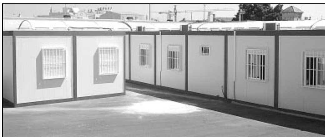
Las aulas prefabricadas, instaladas en el solar junto a nuestra escuela

Las obras supondrán la construcción de un centro completo, integrado por seis aulas de Educación Primaria y tres de Educación Infantil. La previsión es que dichas obras se prolonguen durante un plazo de un año. De esta manera, el objetivo es que, para el próximo curso 2008-2009, los alumnos y alumnas de Miramar ya puedan hacer uso de las nuevas instalaciones. Hay que tener en cuenta que