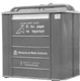
PAPEL Y CARTÓN: COLOR AZUL